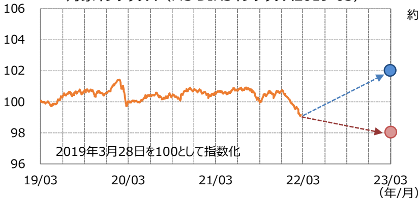
【イメージ図】 対象インデックス（MS DIRSインデックス2019-03）

次回の実績クーポンは約1年後の算出日における累積収益率÷経過年数（4年目）により決定します。当ファンドの実績クーポンには基本保証部分があり、たとえ累積収益率がマイナスとなったとしても一定水準（0.11%）は受け取ることができます。