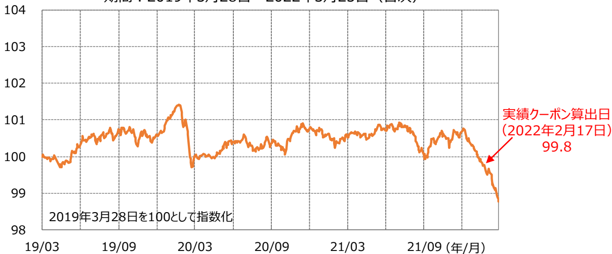
【ファンド設定来の対象インデックスの推移】 期間：2019年3月28日～2022年3月25日（日次）

クーポン算出日における対象インデックス（MS DIRSインデックス2019-03）の値が100以下でしたので、基本保証部分である0.11%が実績クーポンとなります。これにより、第3期決算では分配金を7円（1万口当たり、税引前）とすることに決定しました。