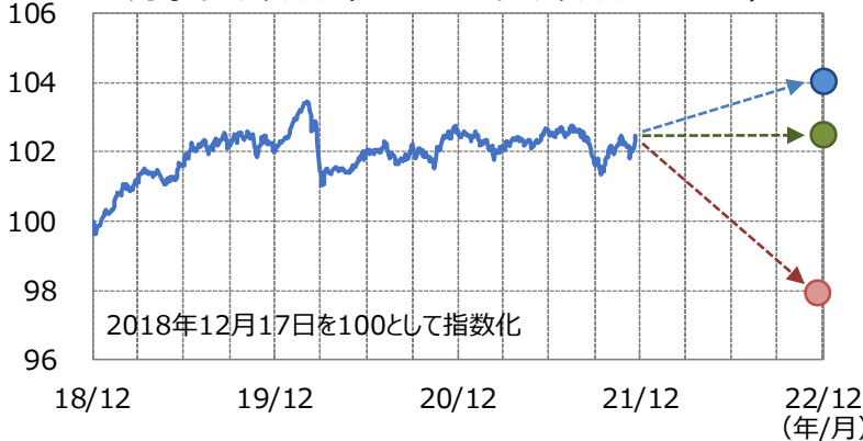
【イメージ図】 対象インデックス（MS DIRSインデックス2018-12）

次回の実績クーポンは約1年後の算出日における累積収益率÷経過年数（4年目）により決定します。 当ファンドの実績クーポンには基本保証部分があり、たとえ累積収益率がマイナスとなったとしても一定水準（0.11%）以上は受け取ることができます。