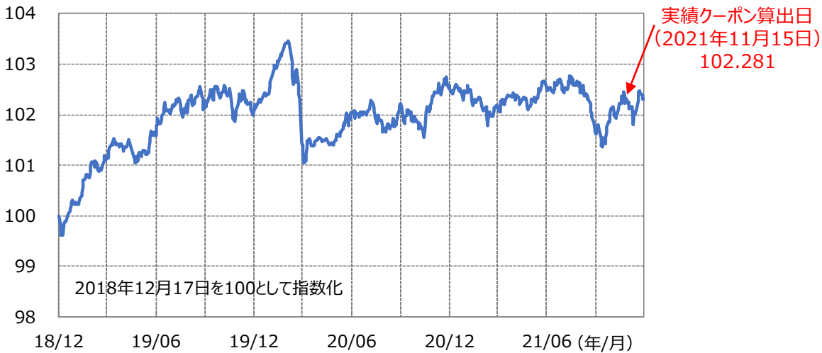
【ファンド設定来の対象インデックス（MS DIRSインデックス2018-12）の推移】 期間：2018年12月17日～2021年12月15日（日次）

クーポン算出日における対象インデックスの累積収益率（2.281%）÷経過年数（3年目）により実績クーポンが決定しました。 これにより、第3期決算では分配金を74円（1万口当たり、税引前）とすることに決定しました。