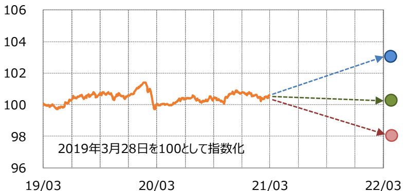
【イメージ図】 対象インデックス（MS DIRSインデックス2019-03）

次回の実績クーポンは約1年後の算出日における累積収益率÷経過年数（3年目）により決定します。当ファンドの実績クーポンには基本保証部分があり、たとえ累積収益率がマイナスとなったとしても一定水準（0.11%）以上は受け取ることができます。