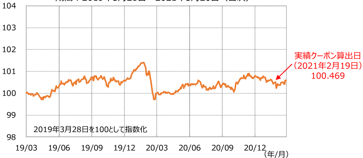
【ファンド設定来の対象インデックスの推移】 期間：2019年3月28日～2021年3月26日（日次）

クーポン算出日における対象インデックス（MS DIRSインデックス2019-03）の累積収益率（0.469%）÷経過年数（2年目）により実績クーポンが決定しました。これにより、第2期決算では分配金を22円（1万口当たり、税引前）とすることに決定しました。