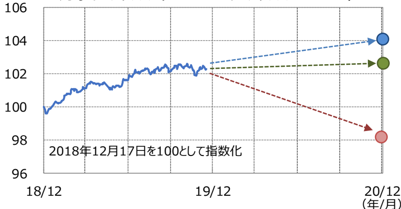
【イメージ図】 対象インデックス（MS DIRSインデックス2018-12）

次回の実績クーポンは約1年後の算出日における累積収益率÷経過年数（2年目）により決定します。 当ファンドの実績クーポンには基本保証部分があり、たとえ累積収益率がマイナスとなったとしても一定水準（0.11%）以上は受け取ることができます。