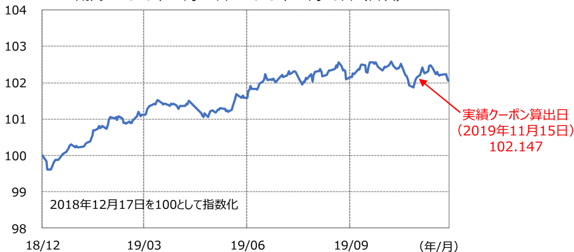
【ファンド設定来の対象インデックス（MS DIRSインデックス2018-12）の推移】 期間：2018年12月17日～2019年12月13日（日次）

クーポン算出日における対象インデックスの累積収益率（2.147%）÷経過年数（1年目）により実績クーポンが決定しました。 これにより、第1期決算では分配金を210円（1万口当たり、税引前）とすることに決定しました。