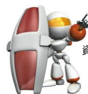
資産の番人コンピューター「マモル」 (ファンドのイメージキャラクターです。)