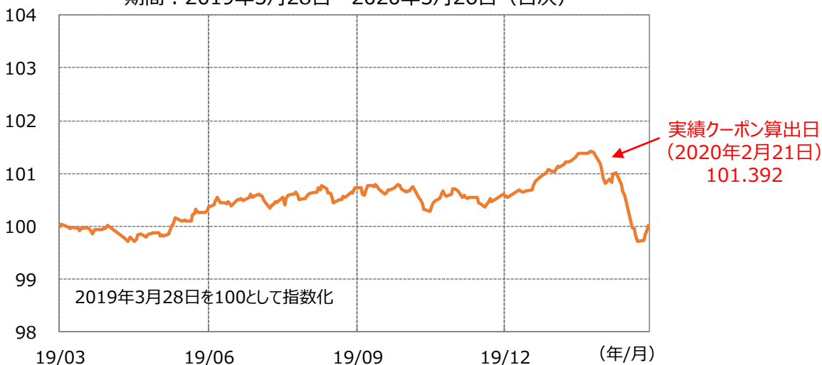
【ファンド設定来の対象インデックスの推移】 期間：2019年3月28日～2020年3月26日（日次）

クーポン算出日における対象インデックス（MS DIRSインデックス2019-03）の累積収益率（1.392%）÷経過年数（1年目）により実績クーポンが決定しました。これにより、第1期決算では分配金を129円（1万口当たり、税引前）とすることに決定しました。