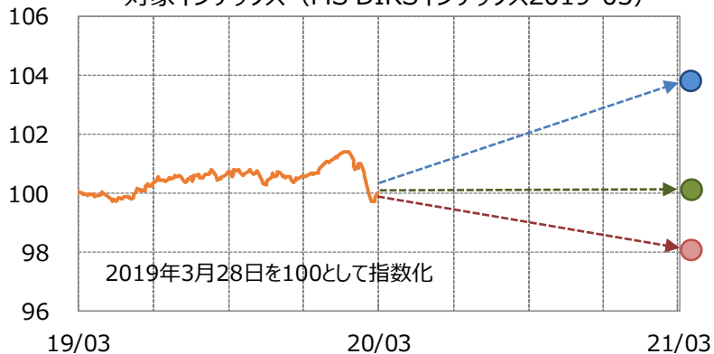
【イメージ図】 対象インデックス（MS DIRSインデックス2019-03）

次回の実績クーポンは約1年後の算出日における累積収益率÷経過年数（2年目）により決定します。当ファンドの実績クーポンには基本保証部分があり、たとえ累積収益率がマイナスとなったとしても一定水準（0.11%）以上は受け取ることができます。