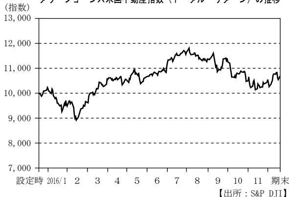
ダウ・ジョーンズ米国不動産指数（トータル・リターン）の推移

(注) ダウ・ジョーンズ米国不動産指数（トータル・リターン）は、米ドルベースの指数を、当ファンドが外国投資信託を組入れた日の前営業日を10,000として指数化したものです。