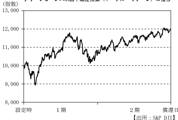
ダウ・ジョーンズ米国不動産指数（トータル・リターン）の推移

（注）ダウ・ジョーンズ米国不動産指数（トータル・リターン）は、米ドルベースの指数を、当ファンドが外国投資信託を組入れた日の前営業日を10,000として指数化したものです。