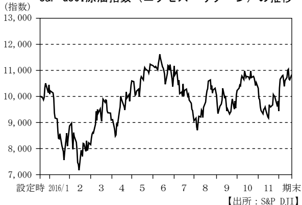
S&P GSCI原油指数（エクセス・リターン）の推移

(注) S&P GSCI原油指数（エクセス・リターン）は、米ドルベースの指数を、当ファンドが外国投資信託を組入れた日の前営業日を10,000として指数化したものです。