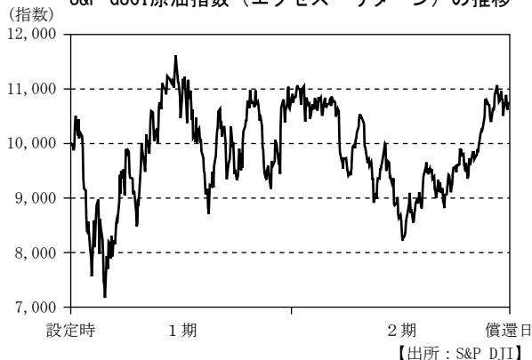
S&P GSCI原油指数（エクセス・リターン）の推移

（注）S&P GSCI原油指数（エクセス・リターン）は、米ドルベースの指数を、当ファンドが外国投資信託を組入れた日の前営業日を10,000として指数化したものです。