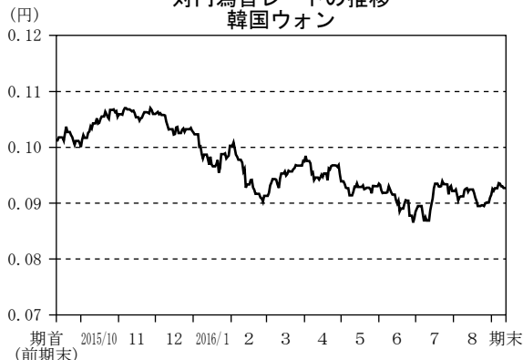
対円為替レートの推移 韓国ウォン

(注) 為替レートは、ノムラ・バンク（ルクセンブルグ）エス・エーより入手した対ユーロ為替を当社が円換算したものです。