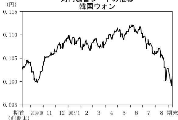
対円為替レートの推移 韓国ウォン

(注) 為替レートは、ノムラ・バンク (ルクセンブルグ) エス・エーより入手した対ユーロ為替を当社が円換算したものです。