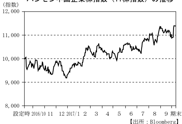
ハンセン中国企業株指数（H株指数）の推移

国庫短期証券3ヵ月物利回りは上昇しました。日銀による「長短金利操作付き量的・質的金融緩和」などの短期金利を低位に抑える金融政策が継続しましたが、日銀の国庫短期証券買入オペ動向に対する不透明感の高まりなどから利回りは上昇し、期初の \Delta 0.28\% から期末は \Delta 0.17\% となりました。