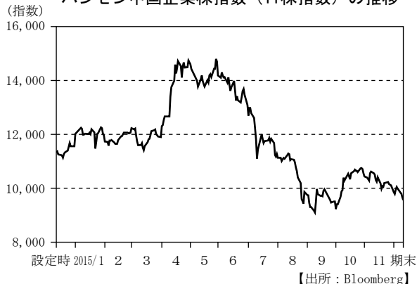
ハンセン中国企業株指数（H株指数）の推移

期初は0.001%でしたが、7月上旬に実施された国庫短期証券入札の結果が堅調だったことから利回りは一時 \Delta 0.077\% まで低下しました。その後、7月中旬の国庫短期証券入札の結果が軟調だったことから再び水準を戻し、0.00%程度に上昇しました。11月に入ると日銀による買入オペ金額の拡大をきっかけに再度利回りは低下し、期末の利回りは \Delta 0.037\% 程度となりました。