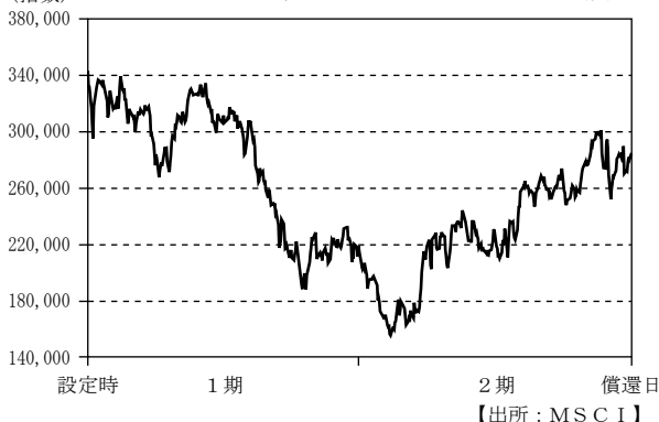
(指数) MSCI ブラジル 25/50 インデックス (円ベース) の推移

(注) MSCI ブラジル 25/50 インデックス (米ドルベース) を当社が独自に円換算した指数を表示しております。