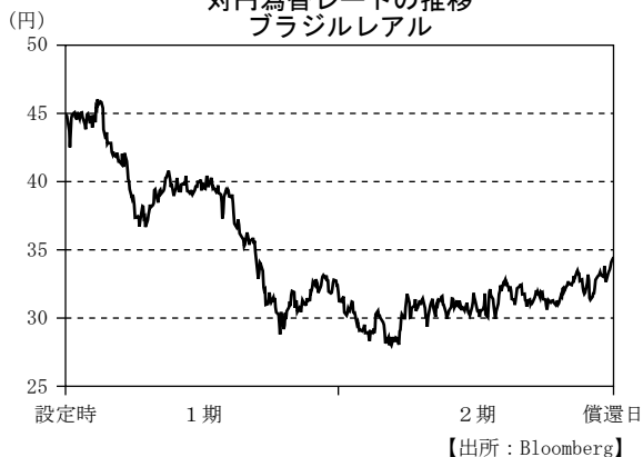
対円為替レート ブラジルリアル

(注) MSCI ブラジル 25/50 インデックス (米ドルベース) を当社が独自に円換算した指数を表示しております。