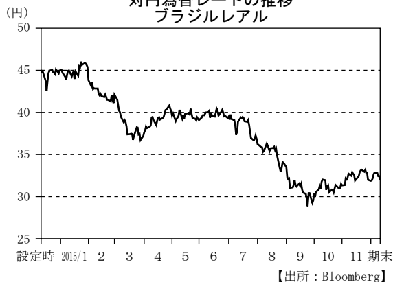
対円為替レートの推移 ブラジルリアル

(注) MSCI ブラジル 25/50 インデックス (米ドルベース) を当社が独自に円換算した指数を表示しております。