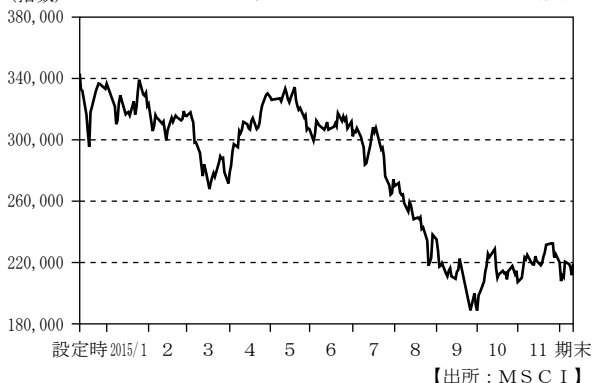
(指数) MSCI ブラジル 25/50 インデックス (円ベース) の推移

(注) MSCI ブラジル 25/50 インデックス (米ドルベース) を当社が独自に円換算した指数を表示しております。