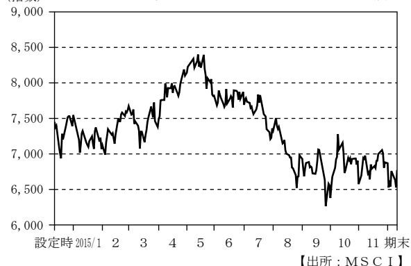
MSCIブラジル 25/50 インデックス (ブラジルリアルベース) の推移

(注) MSCIブラジル 25/50 インデックス (米ドルベース) を当社が独自にブラジルリアル換算した指数を表示しております。