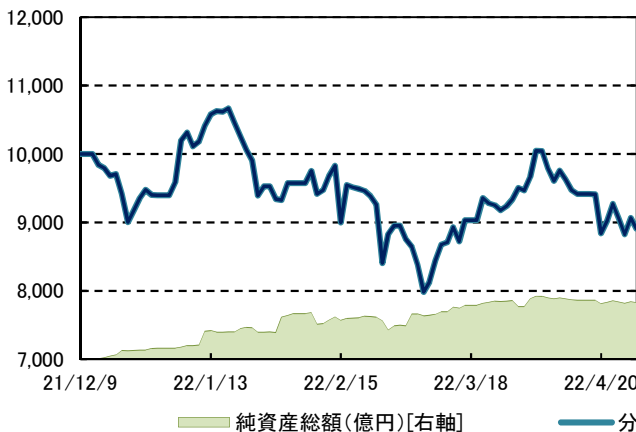
インド・ダブルブル8